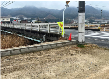
前面道路含む現地写真